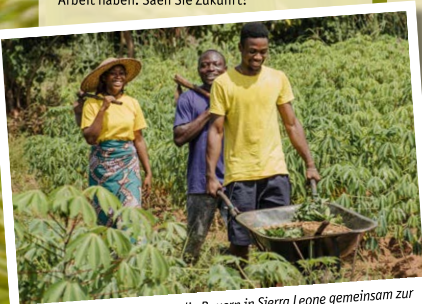
Mit vereinten Kräften wollen die Bauern in Sierra Leone gemeinsam zur Sicherung der Ernährung des Landes beitragen.