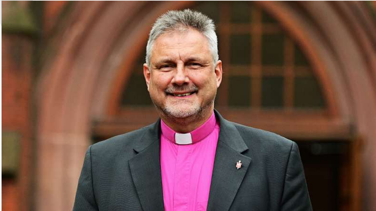
Bildunterschrift 9 Pt Bildnachweis: ...

PDF-Darstellung der Meldung auf www.emk.de vom 5.3.2026